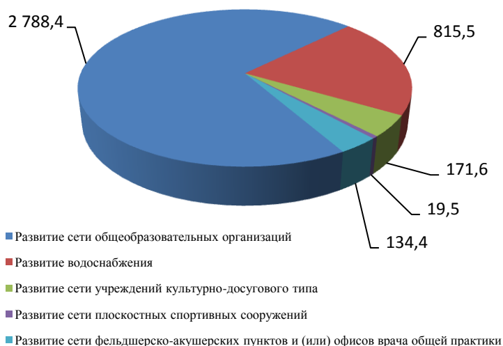
Распределение бюджетных средств, направленных на развитие социальной и коммунальной инфраструктуры в сельской местности с 2011 по 2014 годы (млн рублей)

Наибольший объем бюджетных средств, направленных на развитие социальной и коммунальной инфраструктуры, приходится на развитие сети общеобразовательных организаций в сельской местности – 2 788,4 млн рублей (71,0%).